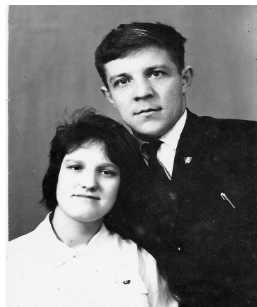
Первая комсомольская свадьба в селе Чернышено: 26.11.1966 года.

Дорогие и многоуважаемые супруги! Вы столько лет прошли рука в руке и пронесли любовь и верность через 50 счастливых и немного грустных лет.